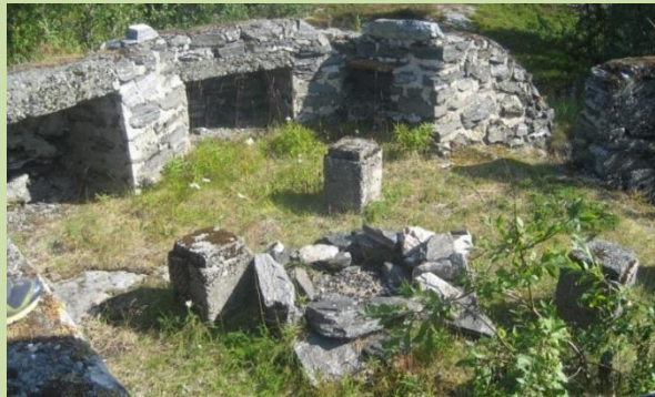
En gammel kanonstilling er tatt i bruk som bål plass

Årøya har stor potensiale som formidlingsarena til et stort antall elever i alle tre kommuner. Bortsett fra skilting av kulturminner på øya finnes en rekke andre muligheter, som å invitere med elever i samband med kulturminneregistreringer og utarbeide informasjonsmateriell til skoleelever.