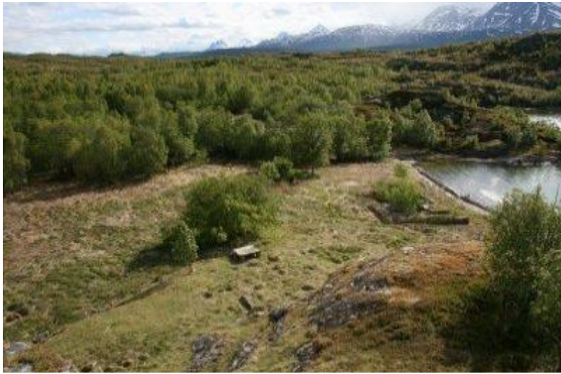
Utsikt ned til den gamle boplassen i bukta. Foto tatt i 2010