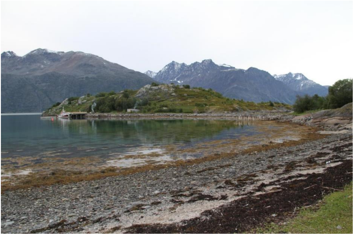
Kaianlegget på Bertholmen i 2010