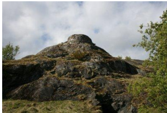
Kanonstilling fra 2. verdenskrig, foto tatt 2010