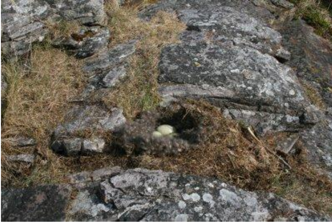
Ærfuglreir på holmen