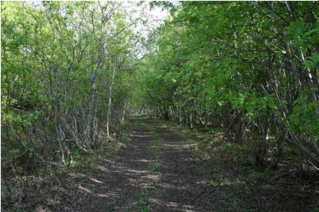
Naturen tar tilbake veien – halve veien opp til Ørnhaugen er ryddet for kratt, 2009 og 2010. Foto tatt i 2010.