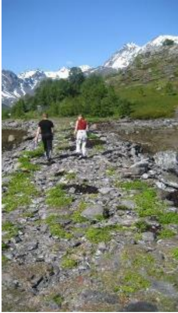
Moloen i 2010