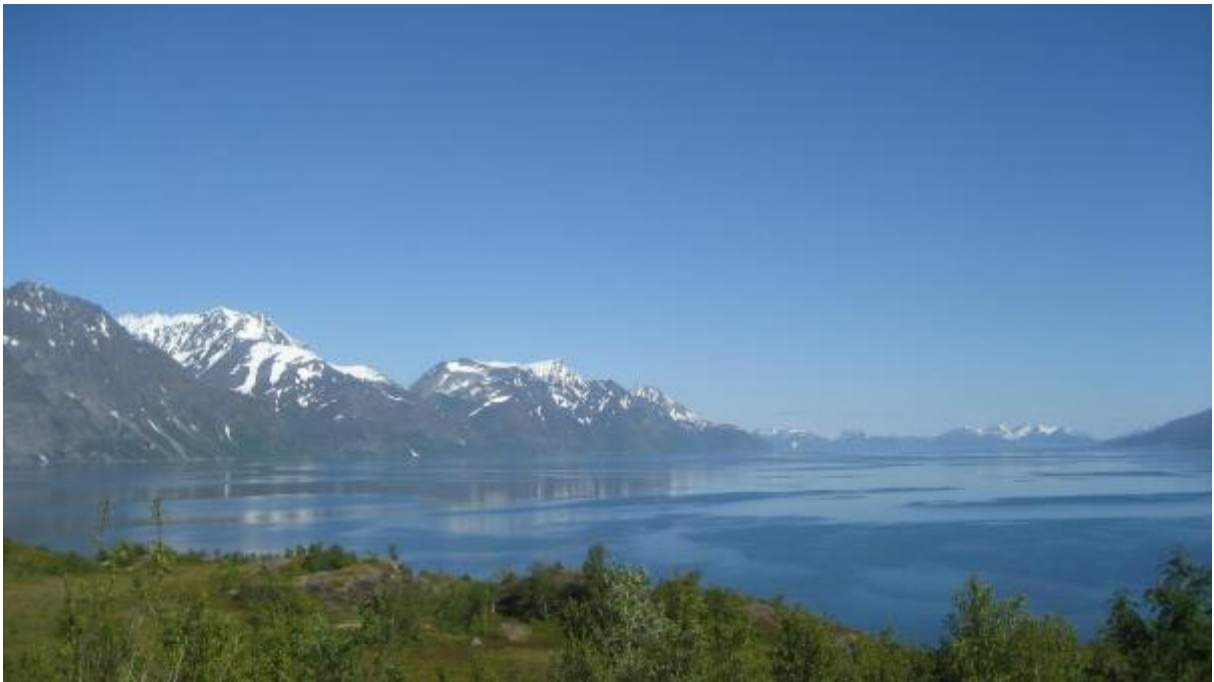
Utsikt fra Ørnhaugen og utover Lyngstadlandet