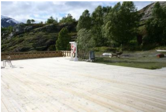
Kaia i 2010